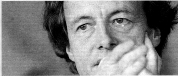
Beat Furrer: „Wir müssen die Möglichkeiten erhöhen, mit Neuer Musik konfrontiert zu werden“